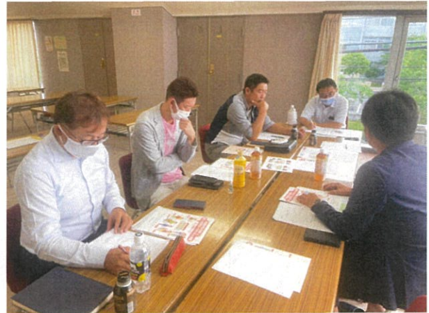
(全体の説明と意見交換のためのグループワークが行われました)